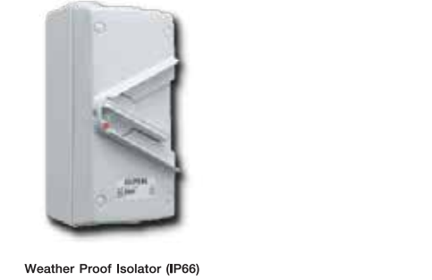
Weather Proof Isolator (IP66)