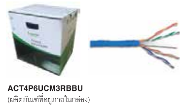
ACT4P6UCM3RBBU (ผลิตภัณฑ์ที่อยู่ภายในกล่อง)